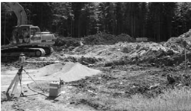
Ausschachtung Hochbehälter Recht