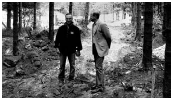
Verlegung Zuleitung Recht / Feckelsborn