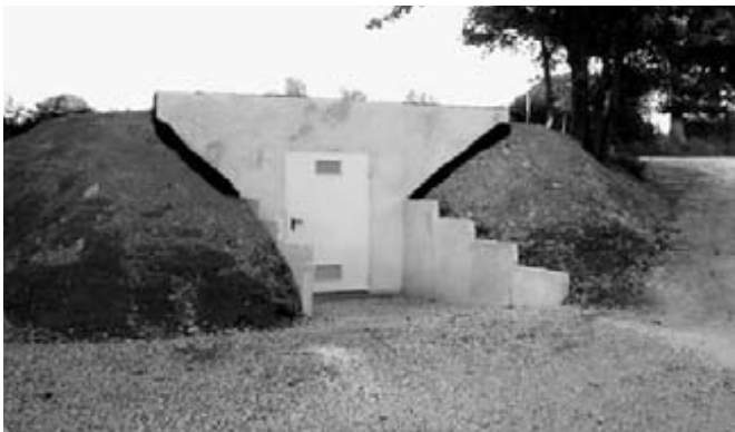
Druckanlage Wallerode / Außenansicht

terführung der Transportleitung von Rodt nach Wallerode und somit die Versorgung von Wallerode sowie den Ortschaften der Altgemeinden Lommersweiler und Schönberg (u.a. Andler). In Wallerode wird eine Druckerhöhungsanlage installiert, um die Druckstabilität im Netz zu garantieren. Diese Druckanlage (mit 42.000 € veranschlagt) ist ein Kernstück in der Gesamtverteilung und gewährleistet die Versorgung und Einspeisung in das Verteilernetz der Gesellschaft SWDE, die für die Wasserverteilung auf dem Gebiet der Altgemeinde Lommersweiler verantwortlich ist.