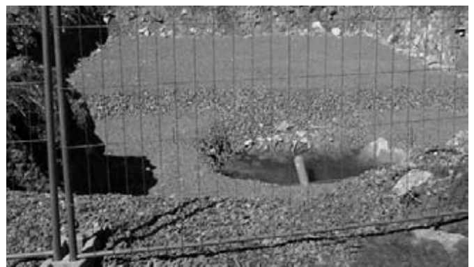
Baugrube Hochbehälter Recht