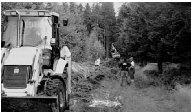
Verlegung Zuleitung Rodt – Recht

sind bereits in vollem Gange. Die Verlegung der Zufuhrleitungen (rund 7 km) sowie der Bau des neuen Hochbehälters (520 m 3 ) sind mit 880.000 € veranschlagt.