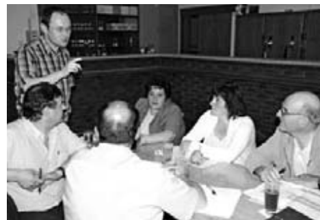
Die Mitglieder der ÖKLE haben sich im Frühsommer intensiv über die lange Liste möglicher Projekte gebeugt und schlüssige Prioritäten definiert, an deren Umsetzung es nun im Herbst geht

Umsetzung definiert werden. Und dabei sind besonders auch die Ideen der Menschen vor Ort gefragt.