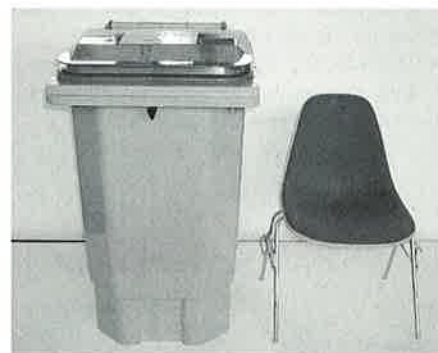
Der 210-Liter DUOBACK braucht nicht wesentlich mehr Platz als ein Küchenstuhl.